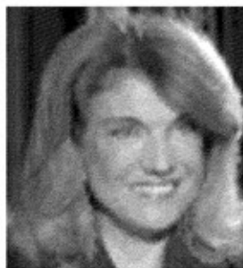
REPORTER. Stella Pende