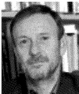
FILOSOFO. Umberto Curi